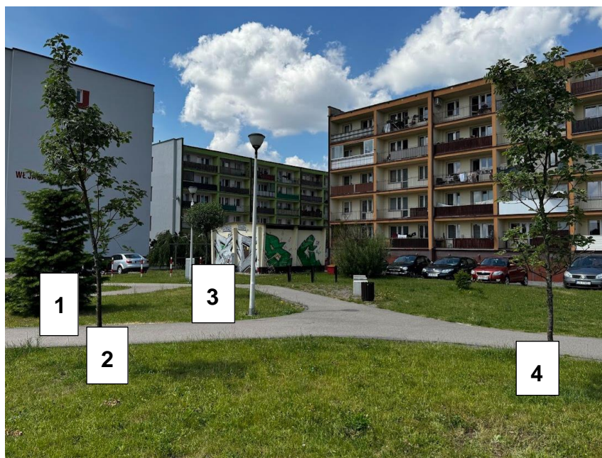
Rysunek 2 Widok na lokalizację trasy kabla elektrycznego i ZK PGE